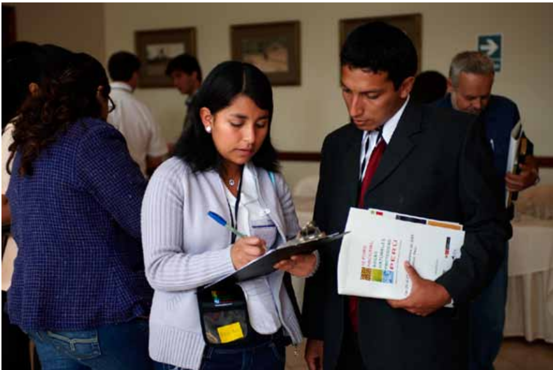
Aplicación de encuestas. Durante los tres días que duró el evento, se aplicaron 211 encuestas que recogieron las diferentes percepciones de los asistentes. (Foto: Thomas Müller / SPDA).