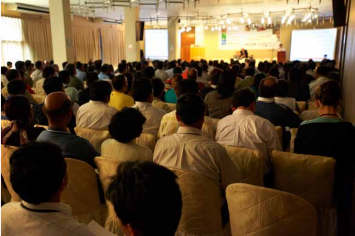
Sala principal del Foro. La sala llena fue un reflejo del éxito en términos de asistencia al evento.