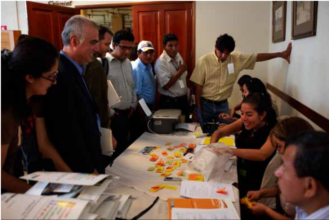
Asistentes al Foro durante la inscripción. Según la lista, participaron en el evento 462 personas..