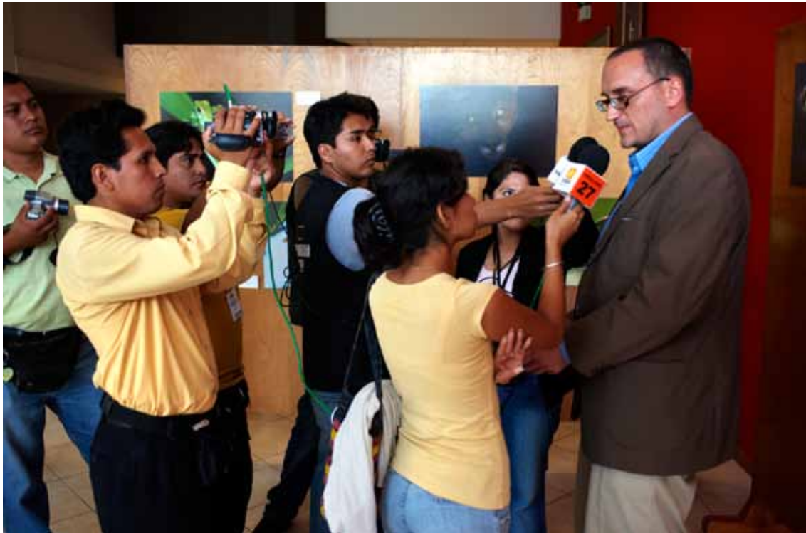
Los medios de comunicación estuvieron presentes, recogiendo las impresiones de los representantes de la comunidad conservacionista y asistentes en general.