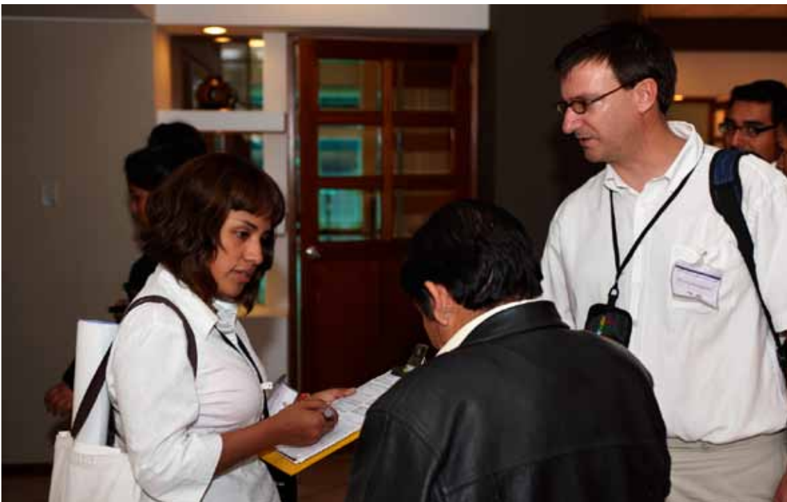
El equipo entrevistador estuvo conformado por 6 personas, cada una de ellas tenía asignada un número de entrevistas por categoría para completar las 53 entrevistas establecidas.