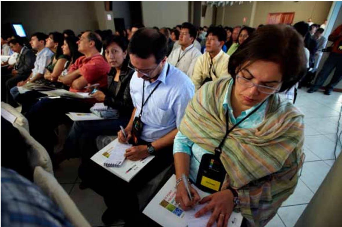
Las encuestas y entrevistas fueron complementadas por la observación participante realizada por el equipo de investigación en los diferentes talleres, plenarias, conferencias, coffee breaks y demás espacios del Foro.