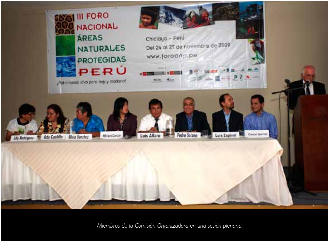
Miembros de la Comisión Organizadora en una sesión plenaria.