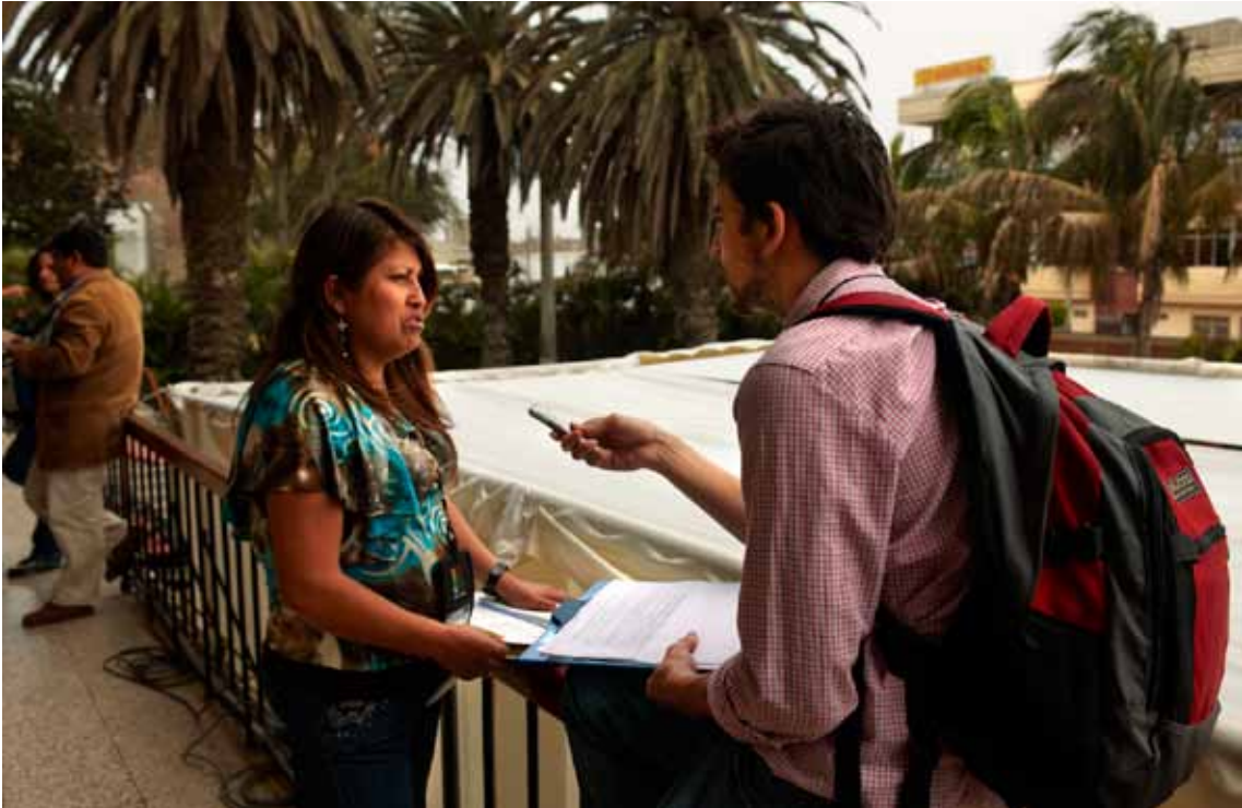
Durante el Foro se realizaron 53 entrevistas semi-estructuradas que reflejaron la variedad de actores, ideas y visiones presentes en el Foro.