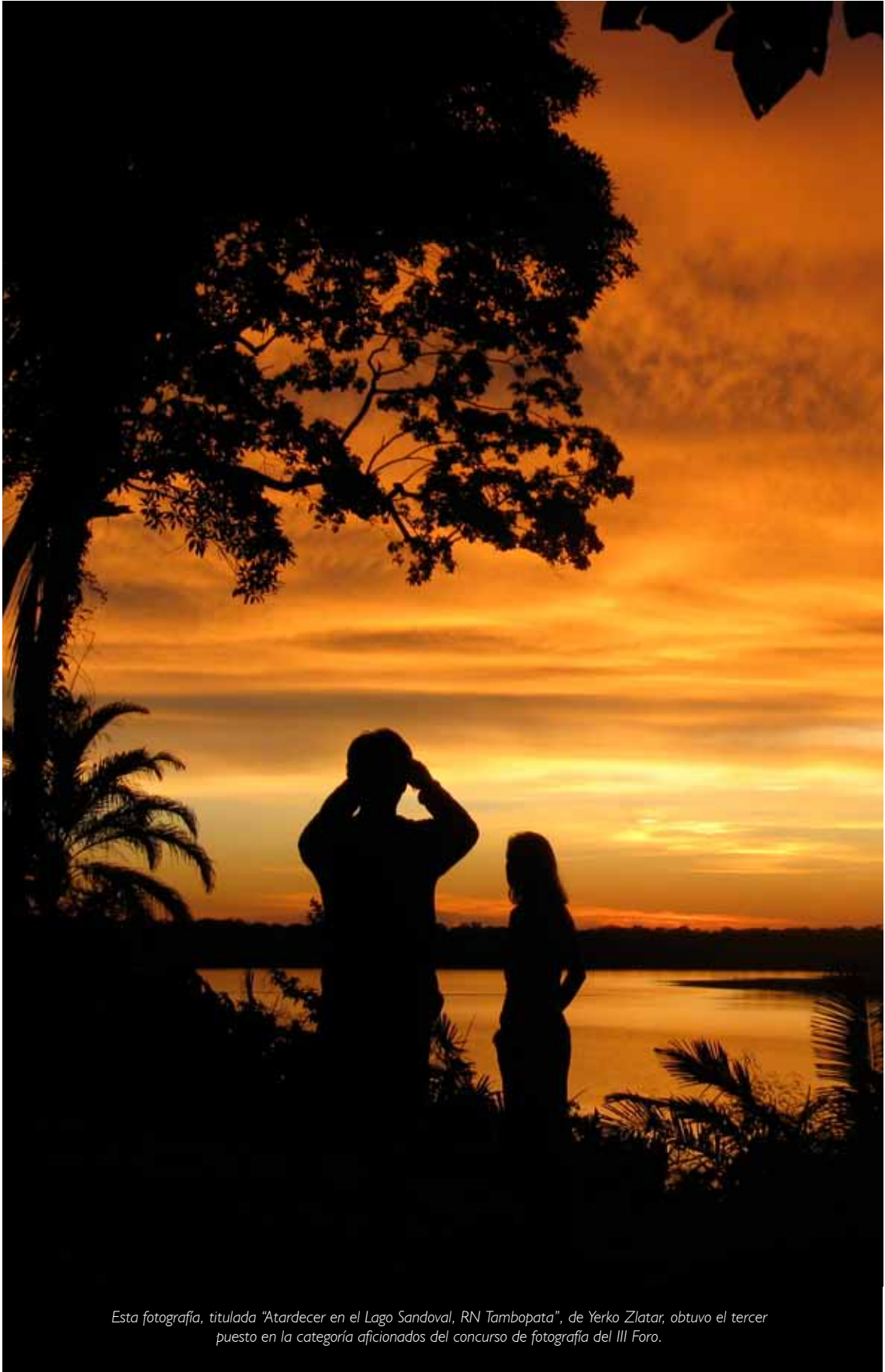
Esta fotografía, titulada "Atardecer en el Lago Sandoval, RN Tambopata", de Yerko Zlatar, obtuvo el tercer puesto en la categoría aficionados del concurso de fotografía del III Foro.