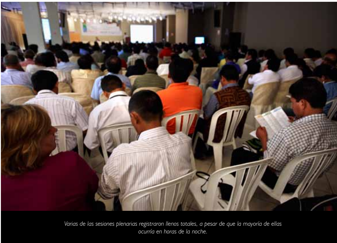
Varias de las sesiones plenarias registraron llenos totales, a pesar de que la mayoría de ellas ocurría en horas de la noche.