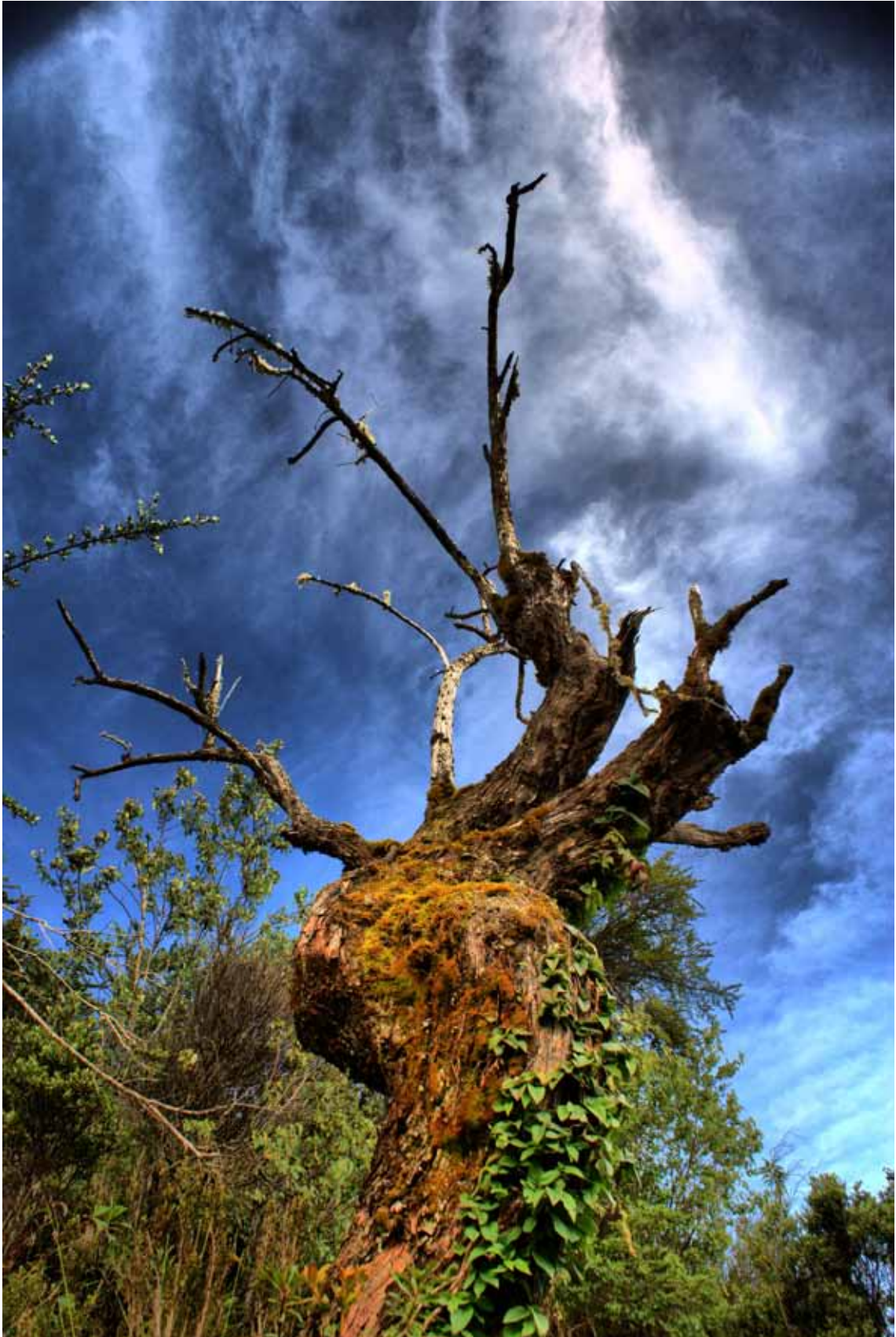
Esta fotografía, titulada "Árbol relicto de Escallonia myrtilloides ZA del SH Machupicchu", de Nelson Anaya, obtuvo el primer puesto de en la categoría profesionales.