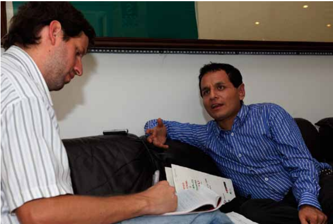
Las entrevistas realizadas aportaron testimonios valiosos para el estudio.