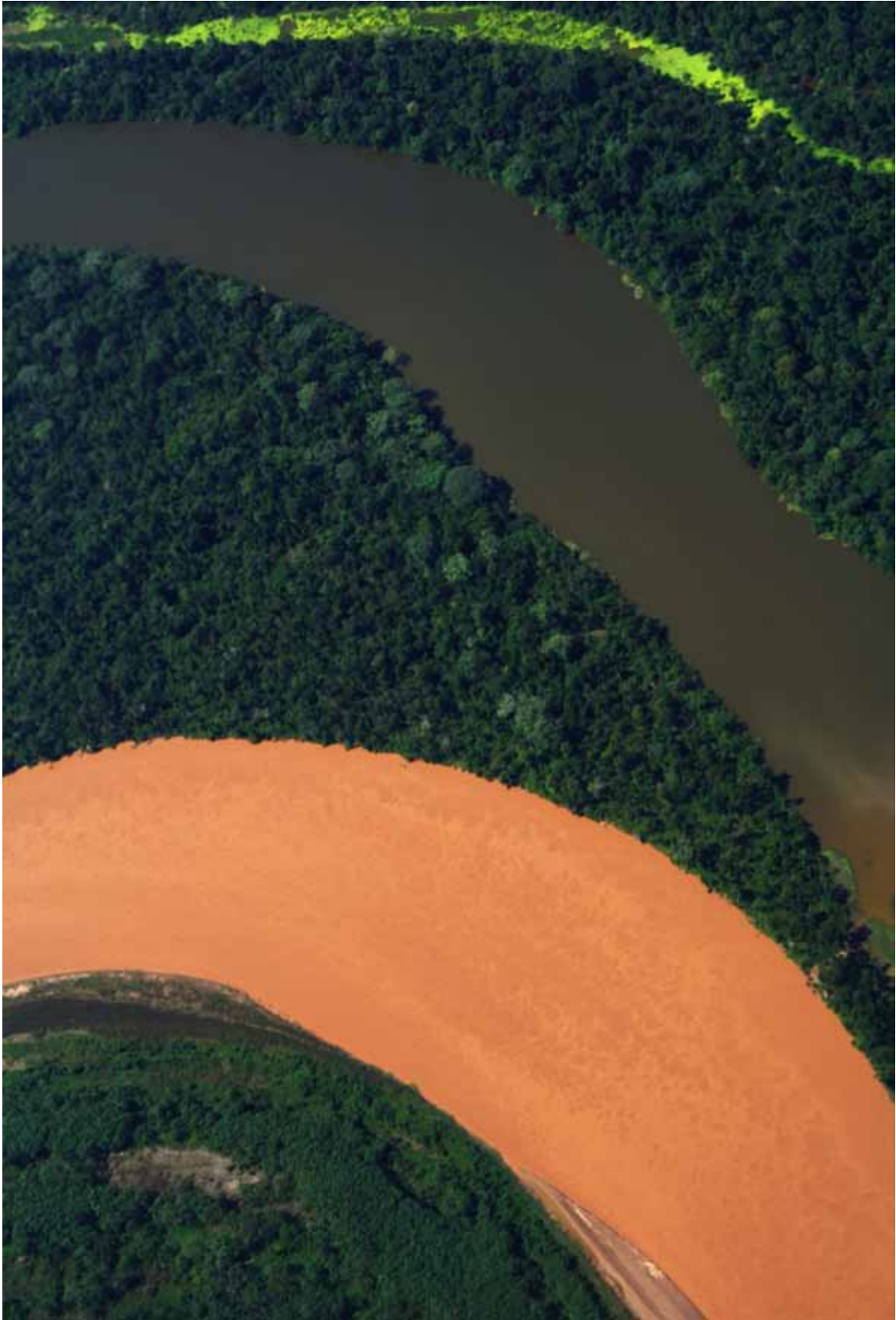
Durante el Foro se exhibieron las fotografías ganadoras del concurso de fotografía organizado para el evento. Esta fotografía, titulada "Sobrevuelo ZR Sierra del Divisor", de Bruno Monteferrí, obtuvo la segunda mención honrosa en la categoría aficionados.