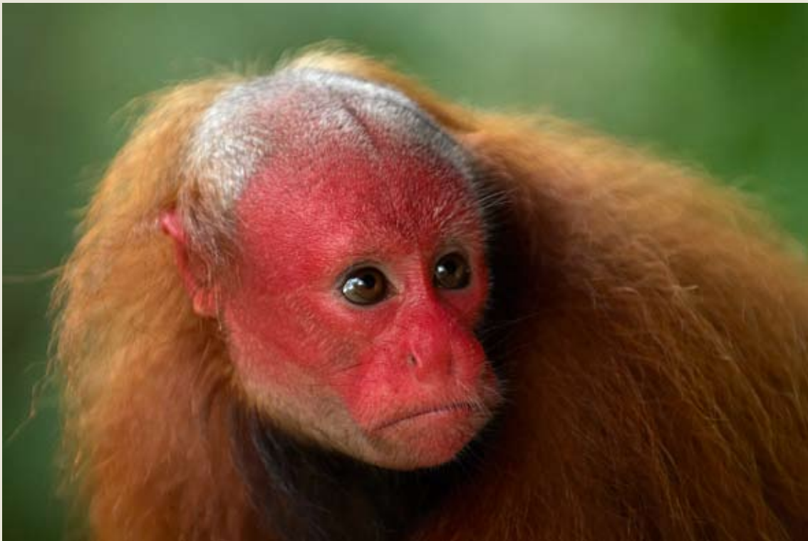
Huapo colorado ( Cacajao calvus ), primate seriamente amenazado en la Amazonía peruana. Diferentes expediciones a Sierra del Divisor han señalado que en la zona reservada las densidades del huapo colorado son bastante altas. Esto se debe en parte a que en este lugar, el huapo colorado no está sujeto a presión de caza, ya que los pobladores locales mencionan que no se le captura porque “parece humano”.

El 23 de junio de 2006 se instaló en Pucallpa la Comisión de Categorización de la Zona Reservada Sierra del Divisor, 15 encargada de formular una propuesta de ordenamiento territorial para su categorización. La Comisión tenía como integrantes a representantes de la Intendencia de Áreas Naturales Protegidas y de la Intendencia Forestal y de Fauna Silvestre de INRENA, los Gobiernos Regionales de Loreto y Ucayali, la Municipalidad Provincial de Ucayali (Contamana-Loreto), el Instituto Nacional de Desarrollo de los Pueblos Andinos, Amazónicos y Afroperuanos - INDEPA, la Asociación Interétnica de Desarrollo de la Selva Peruana - AIDSESP, la Confederación de Nacionalidades Amazónicas del Perú - CONAP, el Ministerio de Relaciones Exteriores, el Ministerio de Energía y Minas, ProNaturaleza y la Sociedad Peruana de Derecho Ambiental - SPDA. Asimismo, hubo actores (por ejemplo, colonos, organizaciones de la sociedad civil y empresas petroleras) que no participaron directamente en las reuniones de la Comisión de Categorización, pero incidieron de manera indirecta durante el proceso participando en los talleres de consulta y canalizando sus propuestas a través de los miembros de la Comisión.