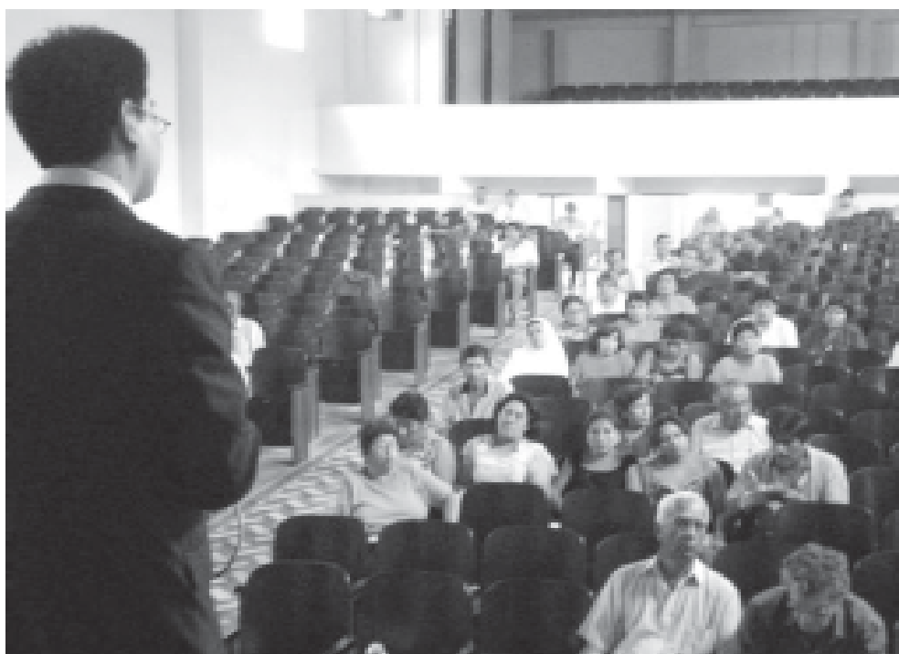
Trabajando por la implementación del Sistema Local de gestión ambiental

Para ello, se establece la dación de la Ordenanza Municipal N° 017-2006-MPP, Ordenanza Marco del Sistema Local de Gestión Ambiental de la provincia, publicada el 23 de setiembre de 2006 en el Diario Correo.