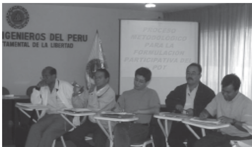
Talleres de Capacitación en Trujillo y Pacasmayo

La Municipalidad Provincial de Pacasmayo ha aprobado mediante Acuerdo de Concejo N° 157-2006-MPP, el «Plan de Capacitación en Materia Ambiental 2006 – 2007», en el cual se priorizan temas a abordar en el transcurso del año y que es necesario reimpulsar para poder cumplir los objetivos generales de mejoramiento de la gestión ambiental municipal.