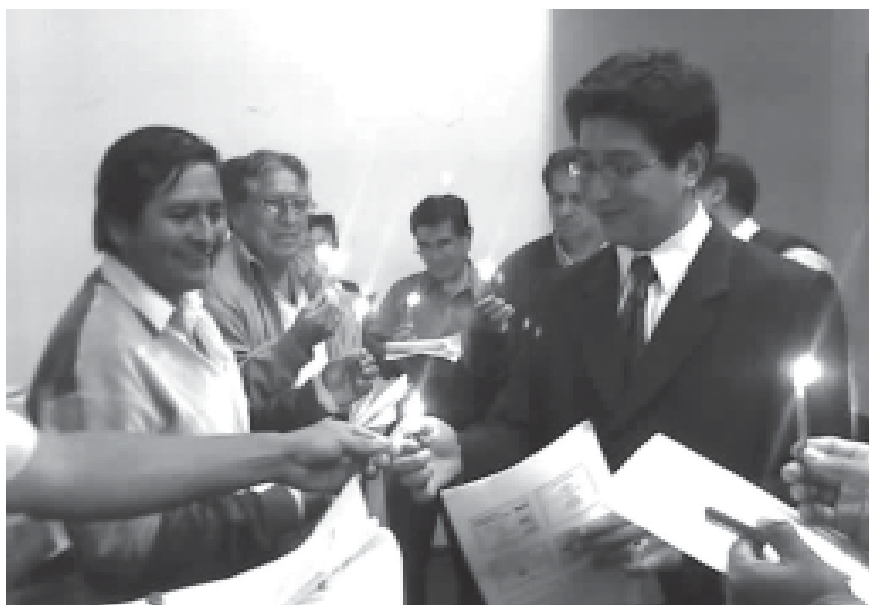
Construyendo la Política Ambiental Local

Para su formalización y validez la Política Ambiental Local de la Municipalidad Provincial de Pacasmayo fue aprobada mediante Ordenanza Municipal N° 014-2006-MPP y ha sido publicada el 23 de setiembre de 2006 en el Diario Correo.