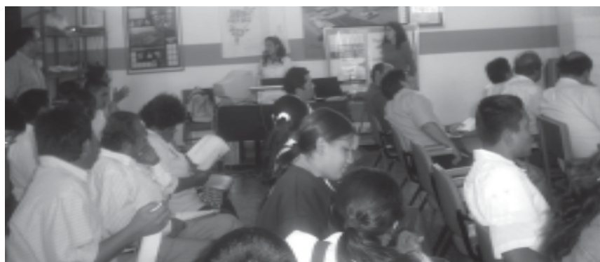
Sesiones participativas de la CAM en la provincia de Pacasmayo

Asimismo, para todos estos procesos, han participado de talleres y consultas públicas efectuadas para la sociabilización de los instrumentos de gestión ambiental promovidos por la CAM.