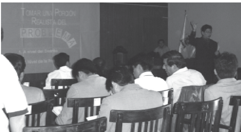
Preparando el Plan y la Agenda Ambiental de la provincia de Pacasmayo

Actualmente, se ha aprobado la Agenda Ambiental Local del 2006 al 2008 mediante la Ordenanza Municipal N° 015-2006-MPP, en ella están las tareas que deben ser cumplidas para empezar a trabajar a fin de lograr los objetivos establecidos en el Plan de Acción Ambiental Local.