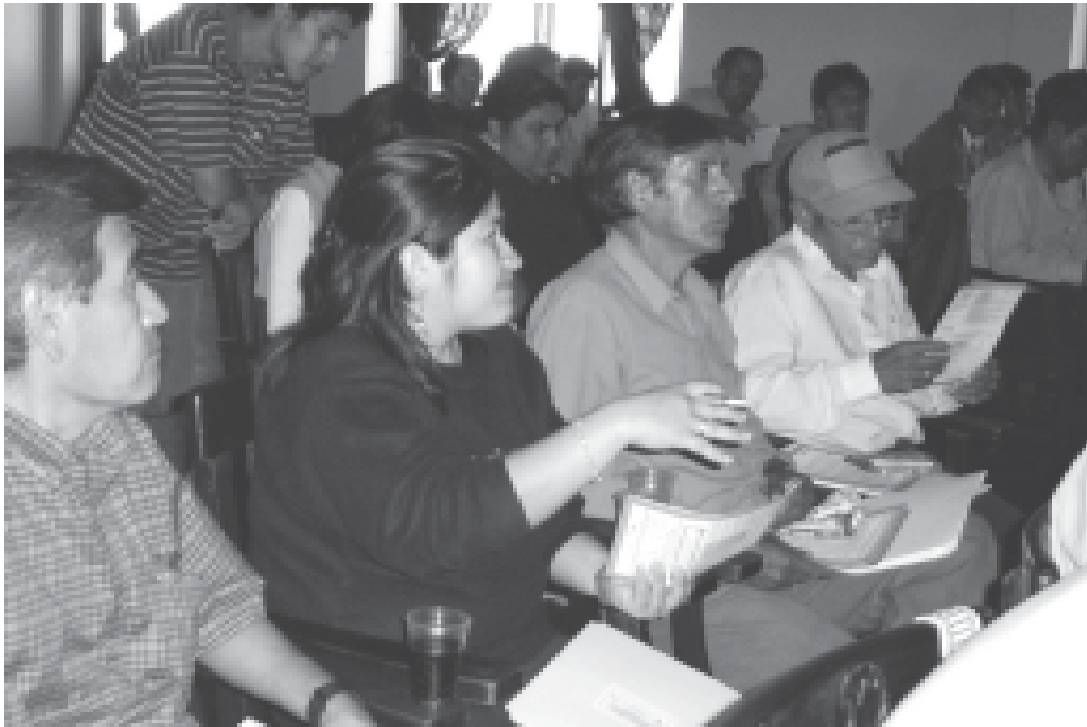
Priorizando los problemas ambientales

Entonces, si bien estos no son todos los problemas ambientales de la provincia, marcan el punto de partida ya que son problemas que necesitan una solución inmediata. Por ello, a partir de aquí, se plantea la elaboración de un Plan de Acción Ambiental Local y de una Agenda Ambiental Local.