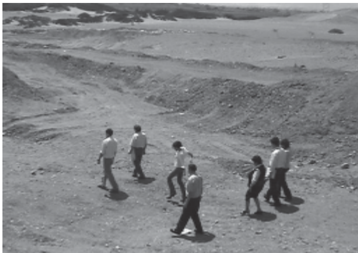
Visitas de campo y talleres sobre el manejo de residuos sólidos

El PIGARS fue aprobado por Ordenanza Municipal N° 019-2006-MPP y publicado el 23 de setiembre de 2006 en el Diario Correo.