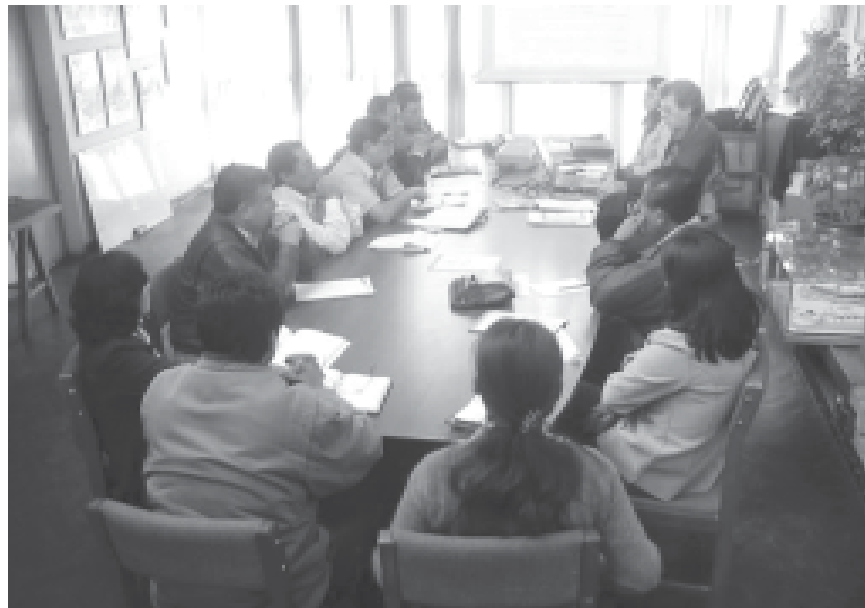
Participación y Apoyo a la Comisión Ambiental Regional Sierra Ancash