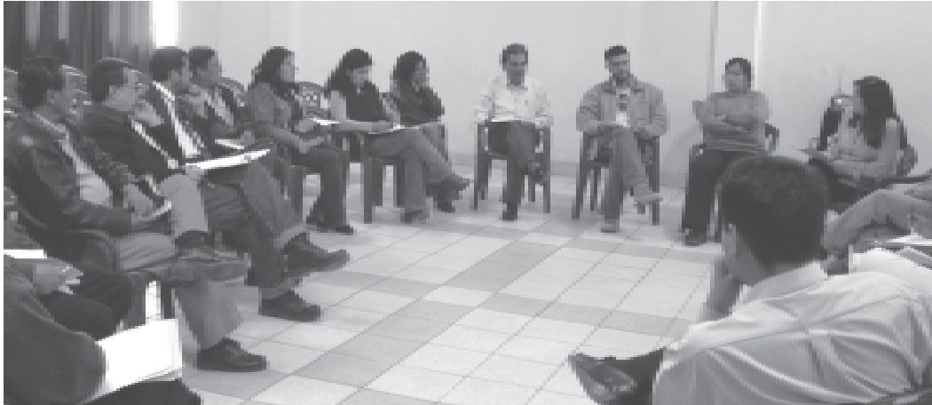
Taller de Resolución de Conflictos, febrero de 2007